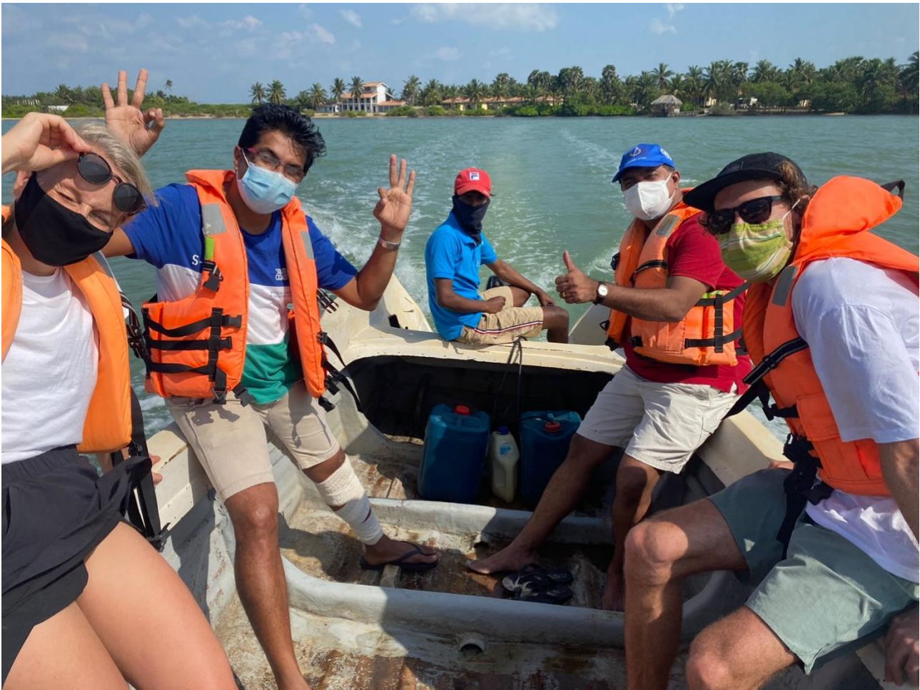
Feltarbeid i Sri Lanka som en del av prosjektet Maressol.

Internasjonalt ansvarlig har ansvar for å utvikle SALTs internasjonale arbeid innenfor de tre fagområdene våre. Vi er godt i gang med prosjektet Maressol, der vi samarbeider med partnere i India og Sri Lanka om å identifisere kilder og årsaker til marin forsøpling i Mannar-regionen og identifisere tiltak for å forebygge ny marin forsøpling i området.