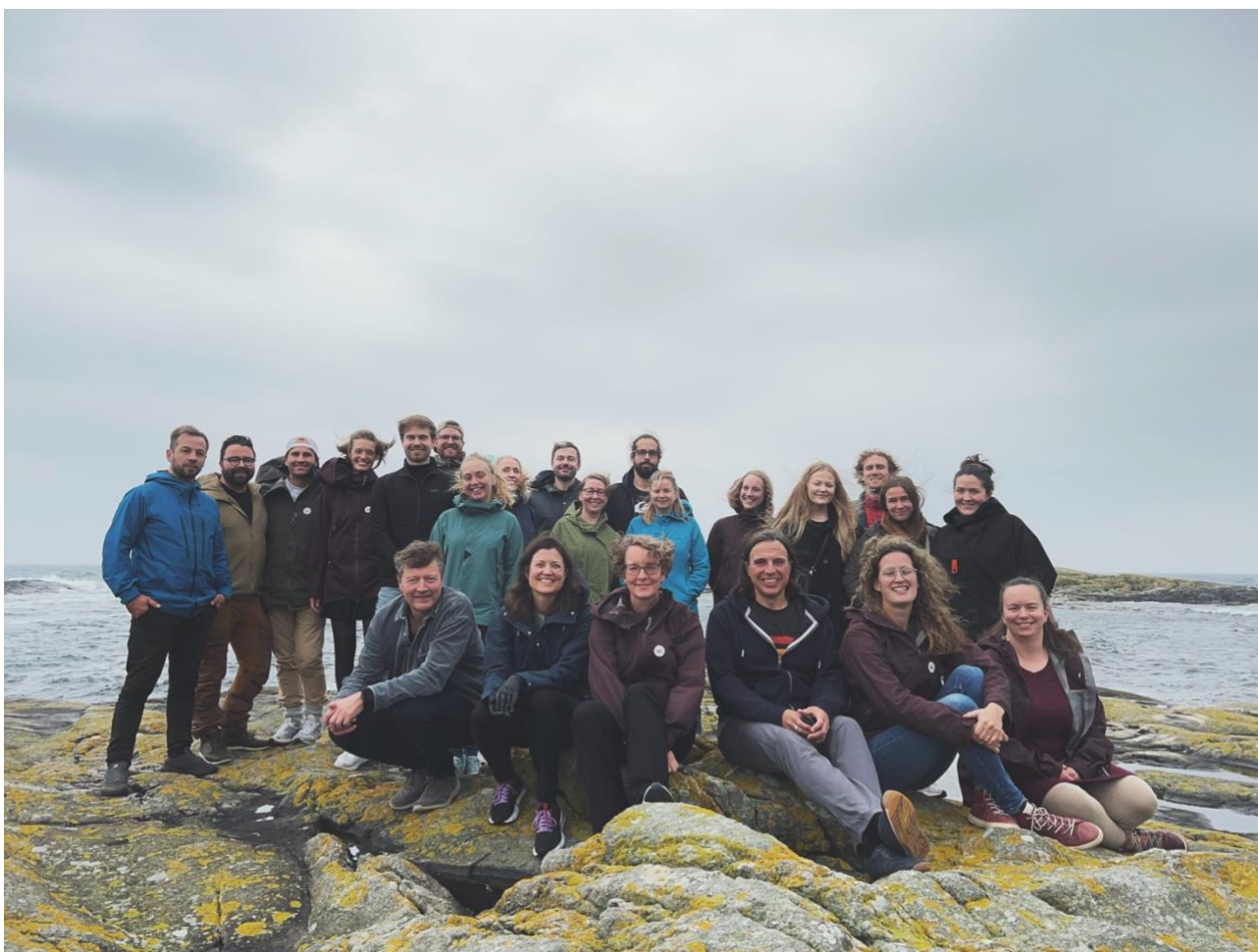
Hele bedriften samlet i Raet nasjonalpark i forbindelse med studietur til Arendal i 2023.

I september 2024 dro bedriften på studietur til Arendal. Her besøkte vi GRID-Arendal og Vitensenteret og arrangerte et arbeidsverksted med deltakere fra Raet besøksenter, Statsforvalteren, Fylkeskommunen, Arendal kommune, Grimstad kommune, Tvedestrand kommune, Kystverket, NIVA, Sabima, GRID-Arendal, Vitensenteret, Asplan-Viak, Sør-Norges Fiskarlag, Kote null, Gard, Våre strender, Naturvernformundet og Green Bay.